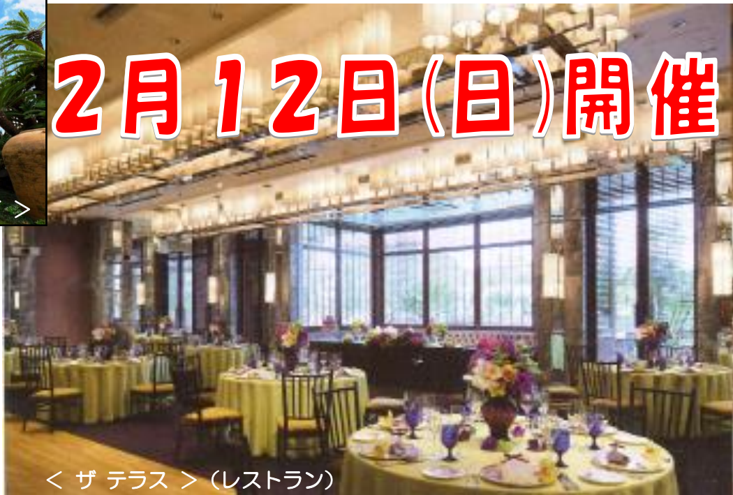
< ザテラス > (レストラン)