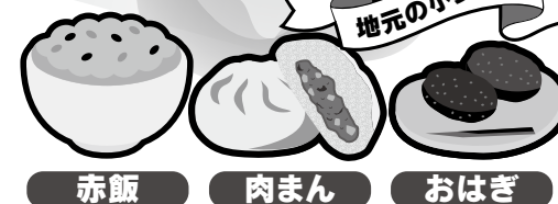
赤飯 肉まん おはぎ